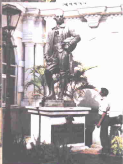
Patung Francis Light

diami oleh sebilangan kecil orang Melayu. Pada masa itu mata pencarian utama yang dijalankan di negeri ini ialah sebagai petani dan nelayan. Pulau Pinang ketika itu menjadi hak mutlak negeri Kedah. Sebelum kedatangan Kapten Francis Light pada tahun 1786, orang Barat yang pertama menjejaki pulau ini adalah sekumpulan 25 orang Inggeris yang diketuai oleh James Lancaster. Mereka mendarat di Pulau Pinang pada bulan Jun 1592.