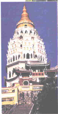
Kuil Kek Lok Si

Kuil ini merupakan kuil yang terindah di Asia Tenggara. Kuil setinggi tujuh tingkat ini mempunyai ketinggian 30 meter. Kuil ini mempunyai bentuk pagoda yang luar biasa. Bahagian bawah kuil ini berbentuk pagoda China, bahagian tengah berupa pagoda Siam, manakala kubah pula adalah berupa pagoda Burma.