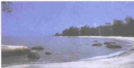
Pantai Batu Feringgi

Mutiara ini. Pulau Pinang menjadi kemegahan bangsa dan negara Malaysia yang tercinta.