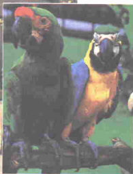
Burung kakatua warna yang terdapat di Taman Burung Pulau Pinang

Taman Burung Pulau Pinang ( Penang Bird Park ) ini terletak di kawasan seluas lima ekar. Lanskapnya dibina dengan begitu menarik sekali dan terdapat lebih daripada 200 spesies burung. Taman ini juga dihiasi dengan berjenis-jenis bunga orkid dan bunga raya. Bayaran sebanyak RM2 dikenakan bagi orang dewasa dan RM1