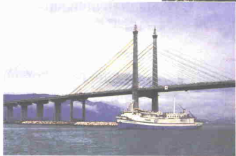
Jambatan Pulau Pinang

Pelabuhan Pulau Pinang pula merupakan pelabuhan yang kedua besar di Malaysia. Sejak pelabuhan ini dibuka