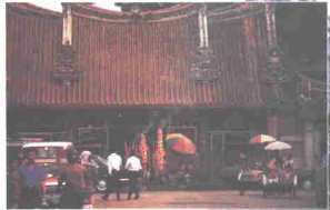
Kuil Kuan Yin Teng

Pulau Pinang. Walaupun bangunan kuil ini agak sederhana, tetapi sentiasa mendapat kunjungan penganut-penganut agama Buddha. Kuil ini dianggap sebagai kuil Dewi Pengampunan.